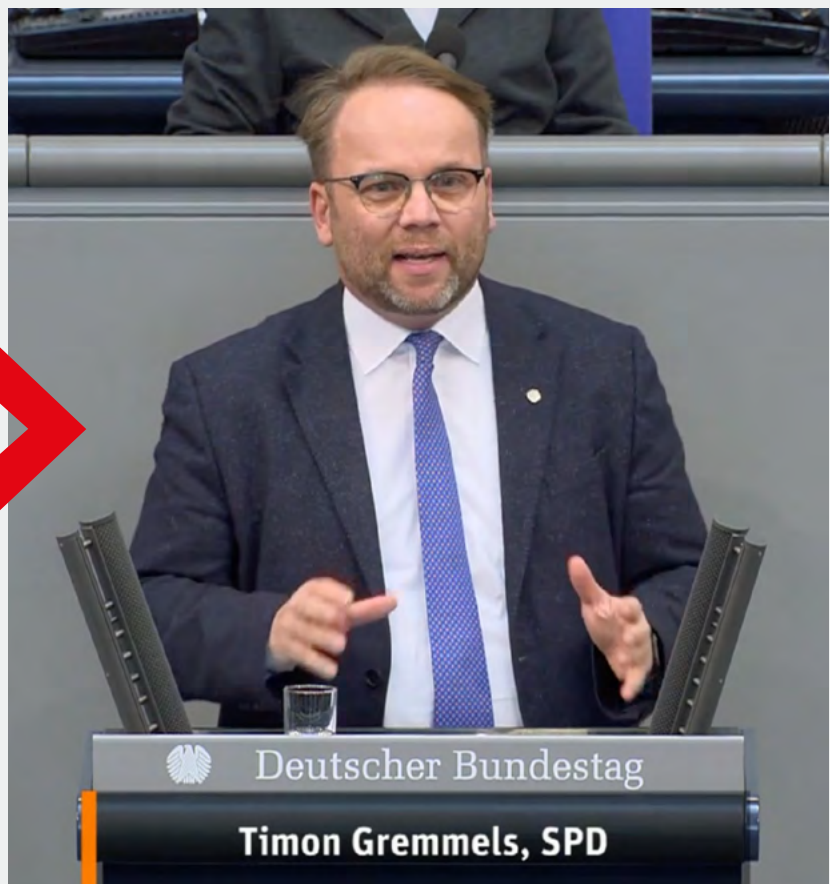
Meine Rede im Bundestag

Der Entwurf sieht eine Rechtsgrundlage für die Enteignung von bestimmten Materialien oder Komponenten vor, die für den Bau von Gasinfrastrukturvorhaben benötigt werden. Darüber hinaus können Inhaber von Unterlagen, die für den Bau der Gasinfrastruktur relevant sind, künftig verpflichtet werden, den Zugang zu entsprechenden Informationen zu gewähren. Den Gesetzesentwurf berieten wir diese Woche in 2./3. Lesung.