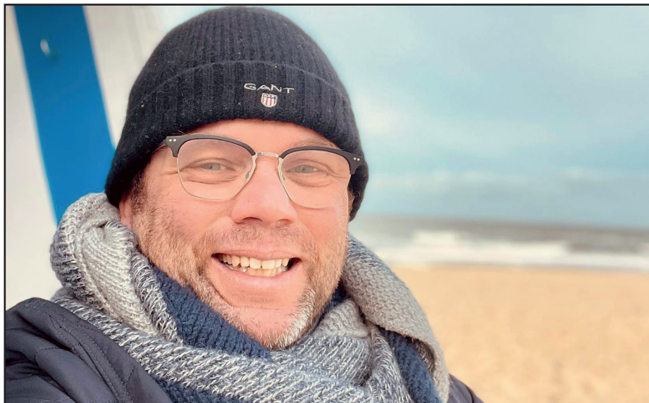
Anfang Januar habe ich bei vielen langen Spaziergängen den Akku aufgeladen, um die jetzt anstehenden Aufgaben mit voller Energie anzupacken.