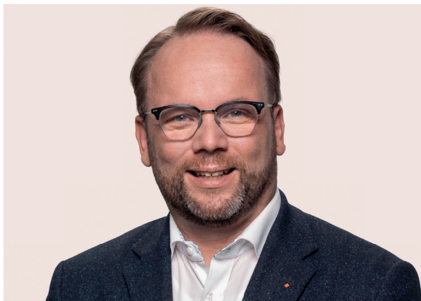
Alles Gute für Euch im neuen Jahr 2022!

an dieser Stelle wünsche ich Euch alles Gute für 2022! Auch im neuen Jahr wird uns die Corona-Pandemie weiterhin im Griff haben. Die neue Ampel-Bundesregierung hat unterdessen gemeinsam mit dem Expertenrat und den Bundesländern weitere Maßnahmen auf den Weg gebracht, um die hohe Infektionsdynamik der Omikron-Welle auf einem Maß zu halten, dass die kritische Infrastruktur unseres Landes nicht durch zusätzliche Krankheitsausfälle unter Druck gerät. Es bleibt dabei: Die Impfung ist der wirksamste Schutz gegen schwere Krankheitsverläufe. Deshalb setzen wir alles daran, eine möglichst hohe Impfquote zu erreichen.