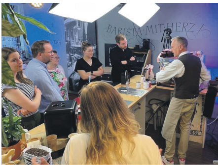
Wir haben in der Kaffeeschule Herz und Bohnen gelernt, wie Kaffee richtig zu bereitet wird.