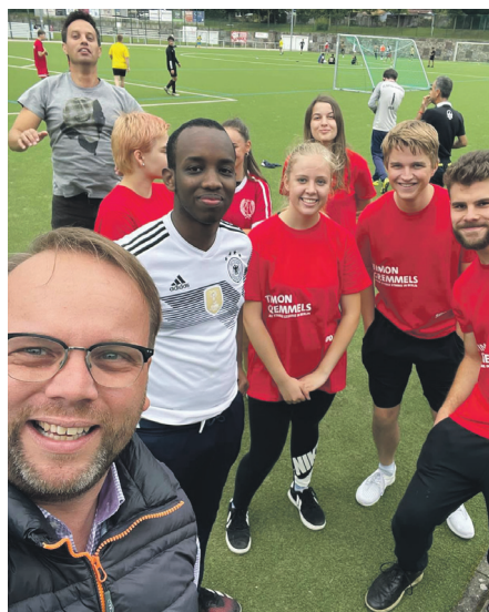
Beim Antirassismusturnier „Kick rechts weg“ im Nordstadstadion.