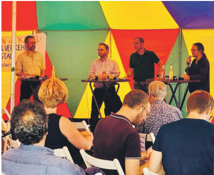
Bei einer intensiven Debatte auf dem Klimacamp am Friedrichsplatz.