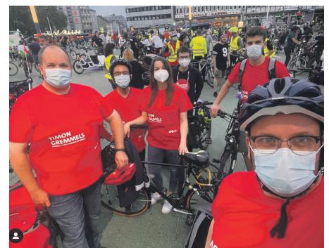
Mit dem „Team Timon“ bei der Kasseler Radnacht unterwegs.