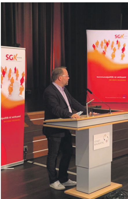
Zu Gast bei der SGK-Landessitzung in der Stadthalle Baunatal.