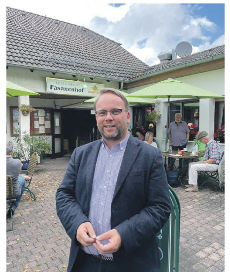
Zu Besuch im Kleingartenverein Fasanenhof.