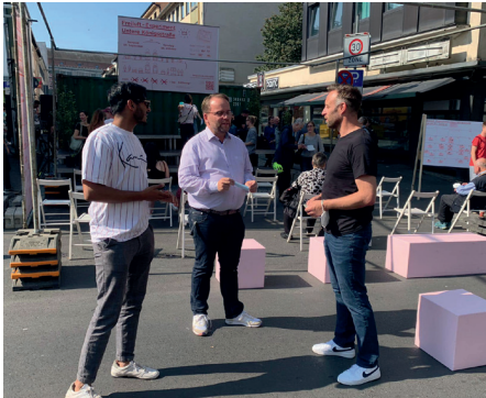
Besichtigung des Freiluftexperiments Untere Königsstraße.