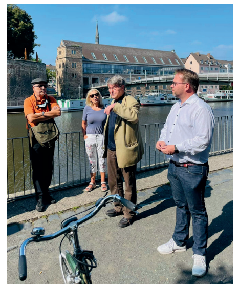
Historischer Rundgang in der Unterneustadt.