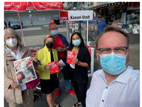
Verteilaktion auf dem Opernplatz.