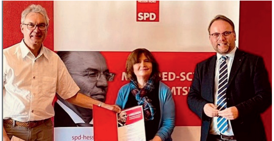
Verleihung des Manfred-Schaub-Ehrenamtspreises der SPD Hessen-Nord in der KSV-Sportwelt in Baunatal an den Kasseler Verein „Nachgefragt e.V.“