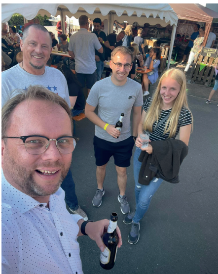
Zu Besuch beim Straßenfest in Niestetal.