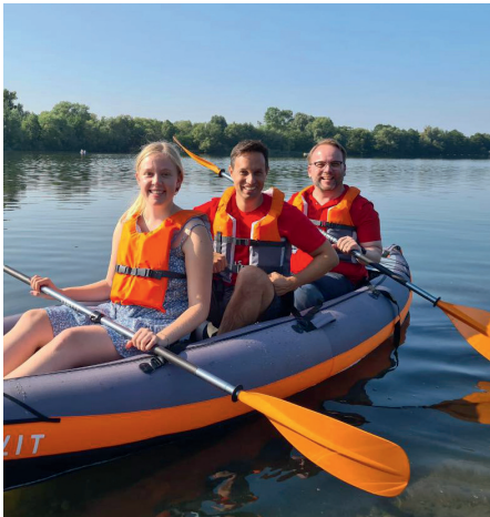
Paddeltour in der Buga.