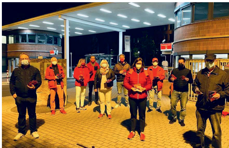
In dieser Woche haben wir für die nordhessische SPD vor den Werkstoren von Volkswagen geworben. Noch 17 Tage bis zur Wahl! Die Stimmung ist gut.

Es ist eine Tragödie, dass die Flutkatastrophe so viele Menschenleben gefordert hat. Wir ziehen die Lehren daraus: Die Folgen des Klimawandels sind längst auch bei uns in Deutschland angekommen. Wir müssen cleverer bauen und Anwohner:innen schützen. Der Katastrophenschutz muss besser funktionieren. Für die konkrete Notsituation insbesondere in Rheinland-Pfalz, Nordrhein-Westfalen und Bayern stellt der Bund nun – nach der ersten Soforthilfe - 30 Milliarden Euro für den Wiederaufbau bereit. Was für ein normales Leben mit Geld zu bezahlen ist, werden wir damit finanzieren.