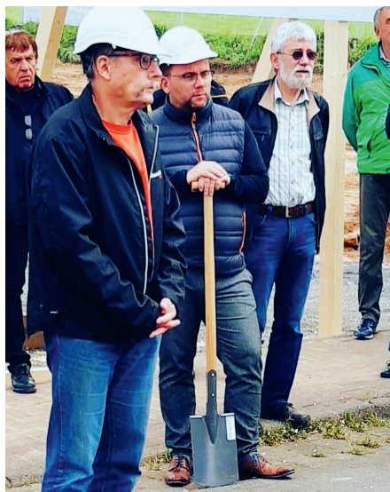
Spatenstich für den Neubau der Kita in Niestetal.