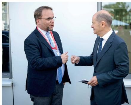
Unser Kanzlerkandidat Olaf Scholz zu Gast bei SMA anlässlich des 40. Firmenjubiläums.