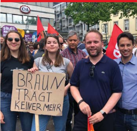
Gemeinsam mit unseren Jusos und meinem Landtagskollegen auf der Mahnwache gegen rechte Hetze