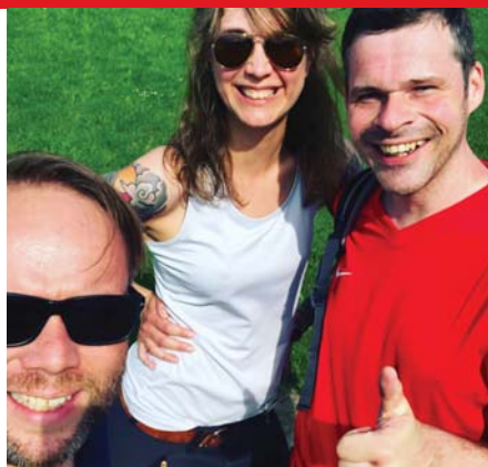
Die „Rotkäppchen“ waren auch dieses Jahr wieder bei den GrimmSteigtage um Nieste unterwegs