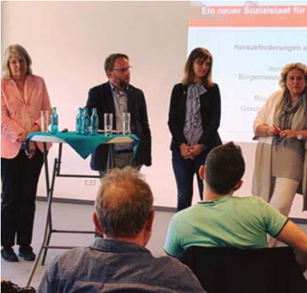
Spannende Veranstaltung zum Sozialstaatskonzept der SPD in der Treppe 4