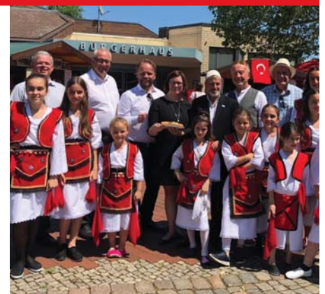
Auf dem 23. Internationalen Fest in Lohfelden

Sofern Sie ausdrücklich eingewilligt haben, verwenden wir Ihre E-Mail-Adresse, um Ihnen regelmäßig Ihre gewünschten Informationen zu übersenden. Für den Empfang der Informationen ist die Angabe einer E-Mail-Adresse ausreichend.