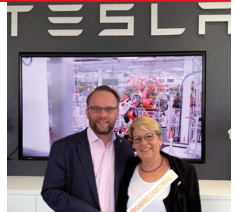
Zu Besuch bei dem Pionier der E-Mobilität in San Francisco