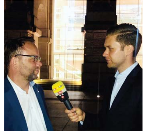
Interview mit dem RTL-Nachtjournal. Im TV heute Abend (28.6., ab 0:00 Uhr)*